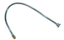
コンパクト・フレキシブル延長ポール