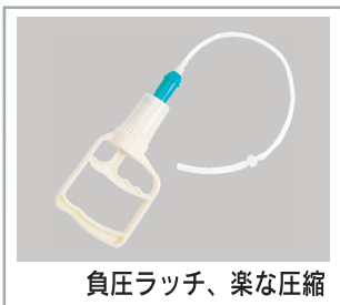
負圧ラッチ、楽な圧縮