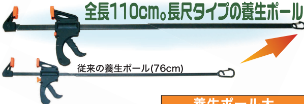
従来の養生ポール(76cm)