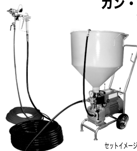
ガン・ホースセット

ラバーホース(12φ)30m // (9φ) 2m 中間ジョイント1/2 // 1/2×3/8 エアレスガンSG-24V 玉吹きATH-2 ロータリーチップ3140 ニューレッドホースNRH-7(金具付)40m