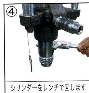
シリンダーをレンチで回します