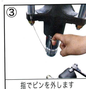
指でピンを外します