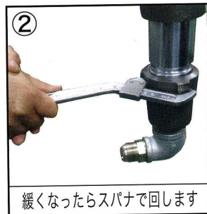
緩くなったらスパナで回します