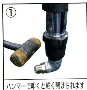
ハンマーで叩くと軽く開けられます