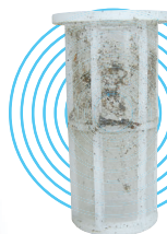
使用後のフィルター