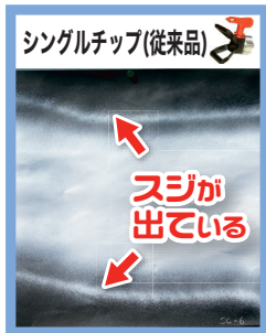
低圧ではスジが出る