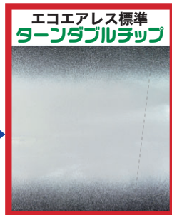
スジなく均一仕上!

注)：飛散軽減の為に中圧13MPaを最大にしています。 それより低い圧でご使用下さい。 ※弾性塗材、タイルなどはできません。