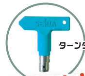
ターンダブルチップ