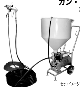
ガン・ホースセット

ラバーホース(12φ)30m // (9φ) 2m 中間ジョイント1/2 // 1/2×3/8 エアレスガンSG-24V 玉吹きATH-2 ロータリーチップ3140 ニューレッドホースNRH-7(金具付)40m